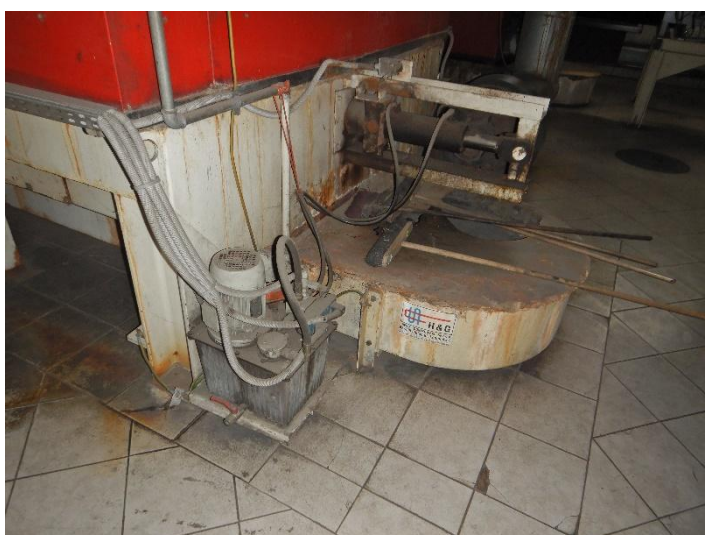
Fot. 4 Widok posadowienia kotła do modernizacji