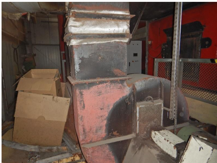
Fot. 5 Widok wentylatora do modernizacji