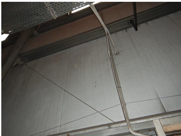
Fot. 7 Widok fragmentu ściany z płyty warstwowej do demontażu i odtworzenia w celu wystawienia oraz wstawienia nowego urządzenia