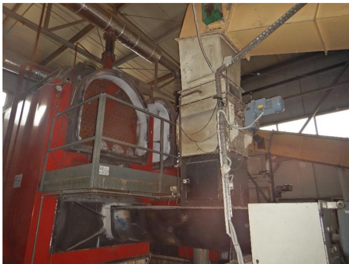
Fot. 2 Widok kotła do modernizacji