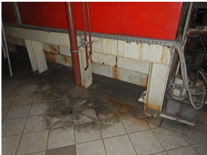
Fot. 3 Widok posadowienia kotła do modernizacji