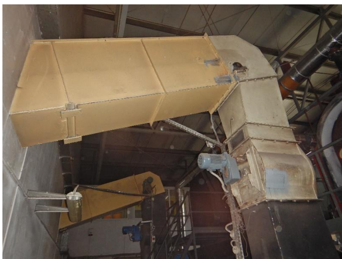
Fot. 9 Widok systemu dostarczania paliwa do modernizowanego kotła