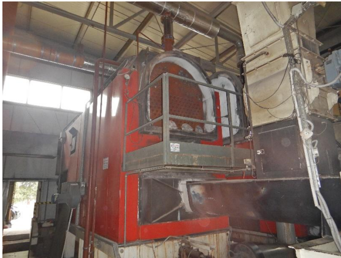
Fot. 1 Widok kotła do modernizacji